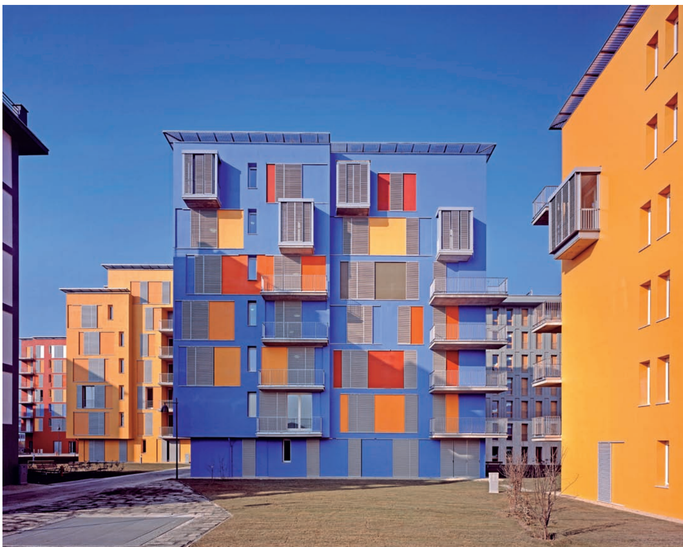
2 Le piazze, i cortili e le nicchie di diverse dimensioni diventano spazi interni abitabili grazie all'uso di colori forti.

«Lo trovo fantastico. Per me è stata una bella possibilità di trattare allo stesso modo gli spazi e gli edifici.»