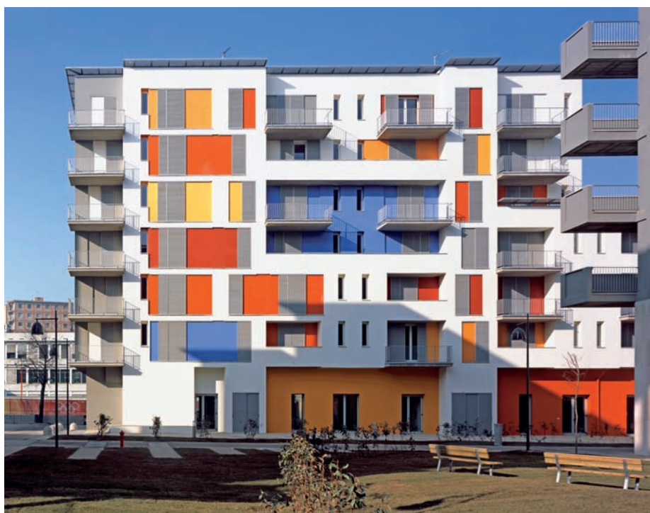
6 Grazie ai tagli colorati a tinte forti nel profilo della facciata, questo blocco ricorda gli edifici di Bruno Taut a Berlino.