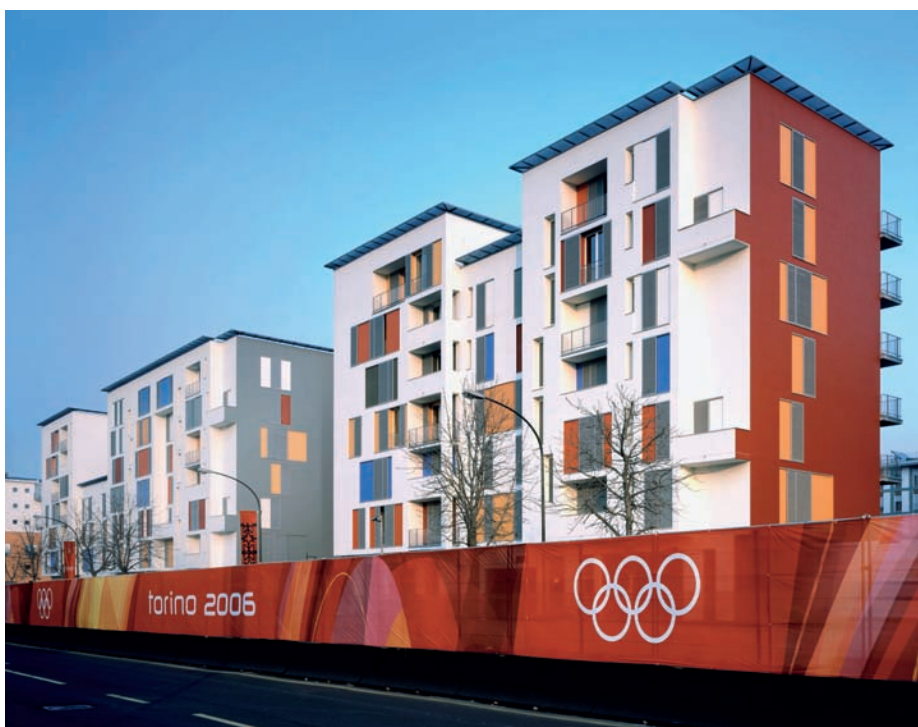
1 Il Villaggio Olimpico a Torino: nelle nicchie delle persiane scorrevoli, nel lotto di mezzo, i colori sventolano come bandiere olimpiche, mentre il bianco totale maschera i leggeri sport della facciata.

Lo schema urbano del quartiere è formato da tre grandi lotti disposti a scacchiera e confinanti uno dopo l'altro con l'esistente mercato coperto. Su questi lotti sono distribuiti edifici di sette piani, disposti come elementi isolati in modo da permettere delle vedute diagonali. Gli edifici sono leggermente rettangolari, orientati a volte in senso trasversale e a volte nel senso della lunghezza così da creare tra di essi piazze, cortili e nicchie di diverse dimensioni. Lo spazio esterno diventa spazio interno abitabile, il cui carattere è fortemente sottolineato dal colore (foto 2), che conferisce ai grandi cubi degli architetti razionalisti una dimensione e un tratto più umani. «Con questo progetto la figura della casa e lo spazio che si forma sono equivalenti» spiega Erich Wiesner.