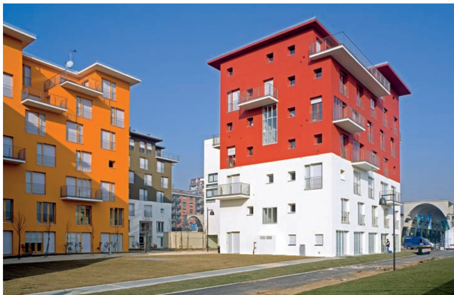
5 Un volume vivacemente colorato su un basamento completamente bianco dà l'impressione che le case siano instabili.

Il quadro che ne deriva è affascinante, l'alternanza di colori è avvincente. Il colore si fonde. Dopo l'utilizzo durante i Giochi olimpici nel febbraio 2006, il quartiere si è di nuovo spopolato. Gli edifici sono stati consegnati solo nell'ottobre 2006. Il singolo visitatore si perde facilmente nel mare di colori, dove un volume di colore neutro, l'edificio con l'alto basamento in pietra naturale, spicca come uno scoglio. I colori sgargianti sono ammorbiditi dall'oscurità e dall'illuminazione artificiale, creando l'impressione di una città mediterranea.