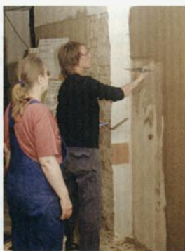
(von oben) Das Seminarhaus des FAL wurde aus Strohballen gebaut und innen wie außen mit Lehm verputzt